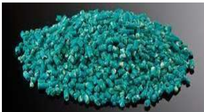
Figura 1. Cebo granulado para roedores