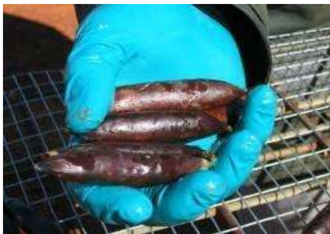
Figura 2. Cebo de gato a base de carne con HSDV que contiene PAPP.

La estrategia que se ha desarrollado para la aplicación del PAPP en la isla Floreana, no implica riesgos para las actividades agrícolas de la isla, los cebos serán colocados en una densidad relativamente baja en la isla de Floreana, dispersándola muy precisamente en sitios preseleccionados (Fisher & Campbell 2017). Cerca de sitios de cultivo, el cebo se colocará manualmente en el suelo, se tomará las coordenadas y se colocará una señal para su recolección posterior, en caso el cebo no sea consumido.